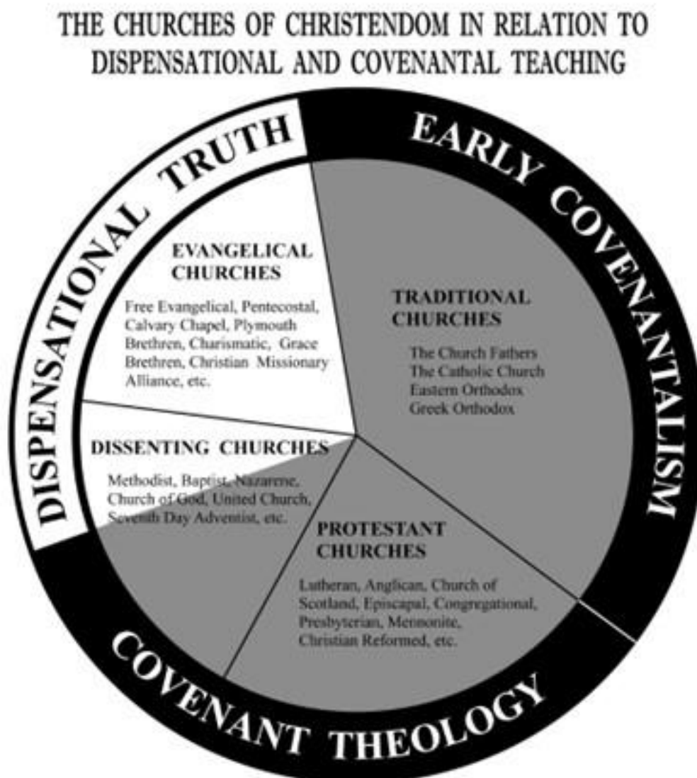
Diagrama Bisericii creștinătății în legătură cu doctrina dispensațională și doctrina legământului

Totuși, această interpretare este plină de erori și foarte problematică, atunci când este analizată logic până la final.